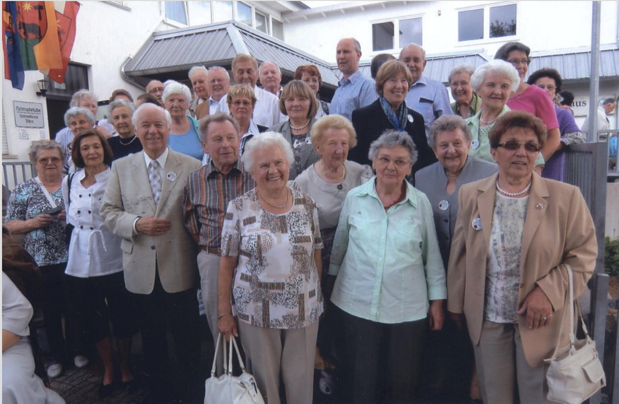
Die starke Gemeinschaft der Bärner Landsleute als Gruppenfoto. Langgöns, 26.6.2011

Wenn nach 66 Jahren Vertreibung fast 400 Menschen aus ganz Deutschland zusammenkommen, um der gemeinsamen Heimat zu gedenken, so ist dies ein lebendiges Zeichen echter Heimmattreue und Heimatliebe.